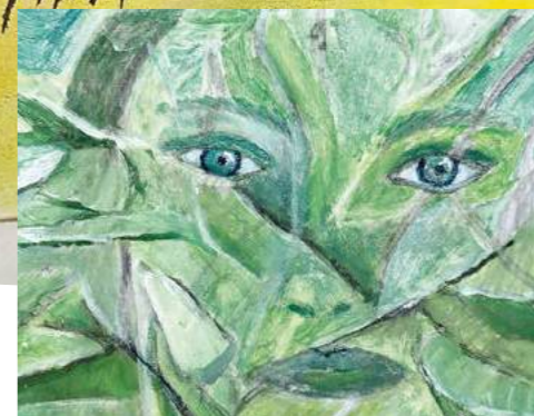
Wir hoffen, der Blick in die Zukunft werde weniger hart. Dieses frühe Bild inspiriert und ist von surrealer Technik geprägt.