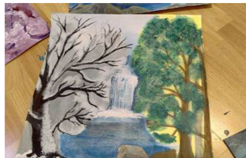
Der Winter ist kalt wie das Leben auf der Gasse, wie komme ich auf die andere Seite?