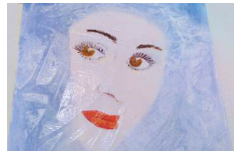
Maltechniken schaue ich mir im Internet an und probiere sie aus. Hier habe ich Plastikdruck benutzt. Max Ernst hatte ähnliche Techniken für den Surrealismus entwickelt.