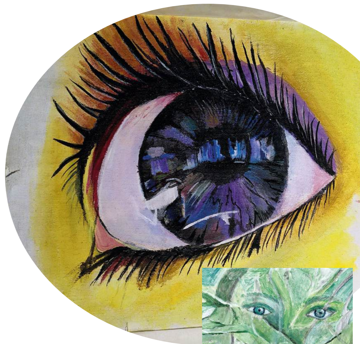
Für die Bewohnerin sind Rosen und Augen wichtige Motive – und Augen sind schwierig zu malen.