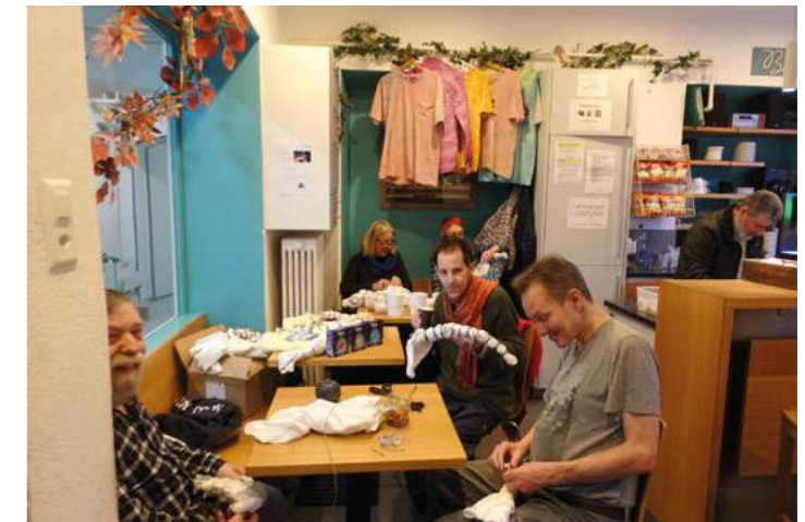
Hippie Revival im Suneboge? Färben von Batikshirts im Bistro

der Rettungsdienst und die Polizei schnell kommen. Notfälle sind glücklicherweise selten. Die anderen Bereiche im Leben. Darüber könnten wir diskutieren und philosophieren. Klar, es wurde gekocht, und die Speisen sollten warm gegessen werden. Das heisst nun nicht, dass wir alles fahren lassen können. Die Redensart spricht davon, dass es vorwärtsgehen soll. «Gäng e chly hü.» Es geht vorwärts. Das Wasser fliesst. Der Tag ist strukturiert. Da sind die Essenszeiten. Wir haben Arbeitseinsätze. Damit es vorangeht, braucht es auch etwas Tempo. Und unsere Bereitschaft, mitzumachen.