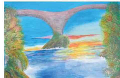
Die berühmte Brücke über die Verzasca macht Hoffnung. Eine Herausforderung ist die Farbe der Felsen, sie werden gerne zu dunkel. Das Bild wird noch weitere Farbschichten erhalten.