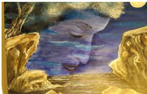
Eine schwere Entscheidung ist wie ein Weg übers Wasser. Felsen bieten Stabilität, wie ein Anker. Das mehrschichtige Bild ist noch nicht fertig.