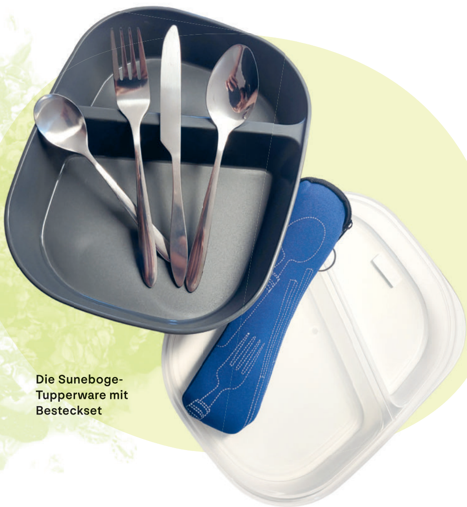
Die Suneboge- Tupperware mit Besteckset