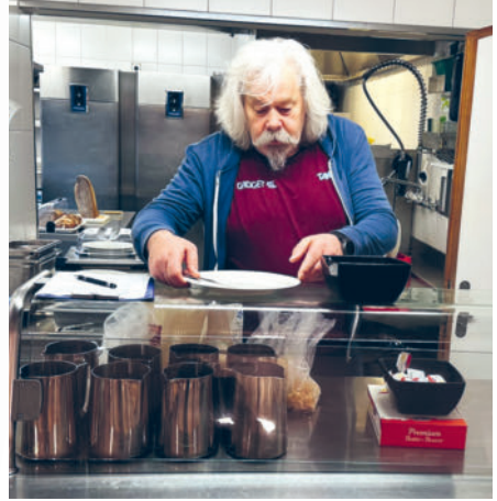
... Butter, Konfi und alles bereitstellen.