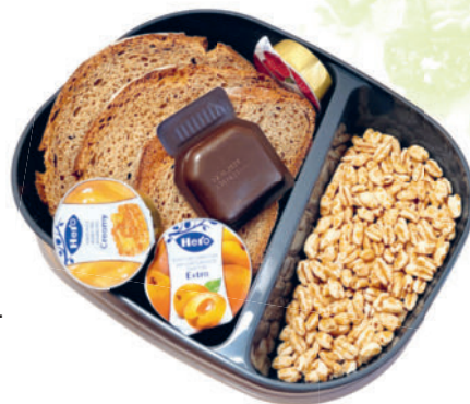
Zmorge to go

Der Abschied vom Gedanken, dass alle zusammen gemeinsam im Speisesaal essen, ist uns nicht leicht gefallen. Doch eine andere Tradition hat Vorrang: Der Suneboge richtet sich nach den Bedürfnissen der Bewohner:innen – und nicht umgekehrt.