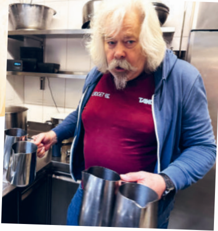
... Tee servieren, ...